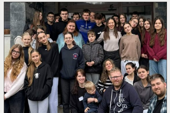
Birmovanci Svätej rodiny 2026