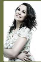
TERÉZIA KRUŽLIAKOVÁ-BABJAKOVÁ MEZZOSOPRÁN