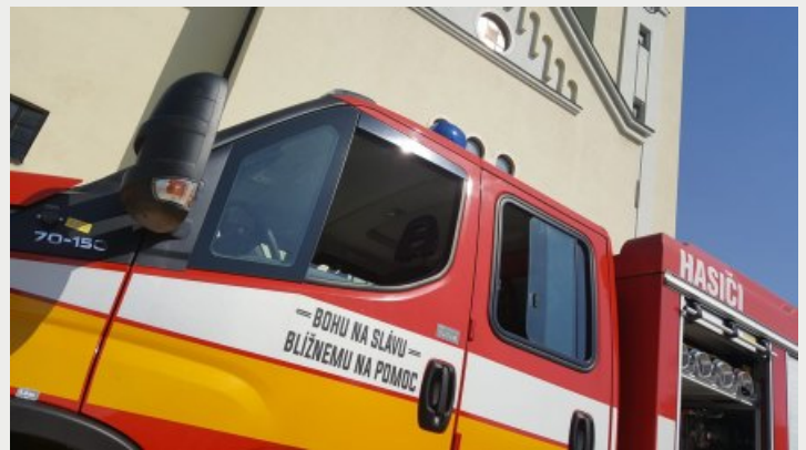
Hasičský zbor pri dezinfekcii v areáli kostola