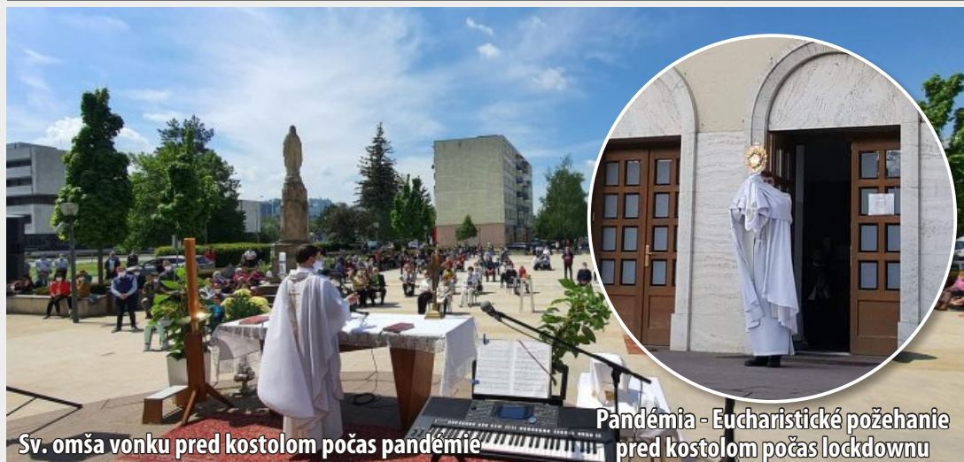
Sv. omša vonku pred kostolom počas pandémie