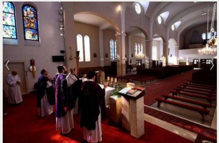
Považská Bystrica, pôstny čas 2020, kňazi slúžia v prázdnom kostole; 15. marec 2020

smutný zostal nárast pohrebov, v dvoch pandemických rokoch sa zvýšili na takmer dvojnásobok.