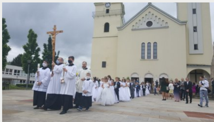
Prvé sv. prijímanie 21. 6. 2020