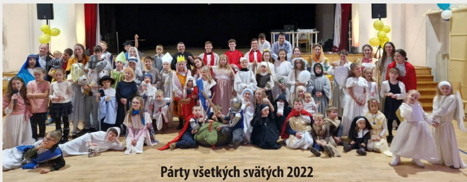
Párty všetkých svätých 2022