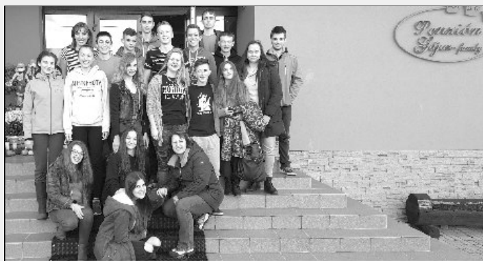
Duchová obnova deviatokov sv. Augustína v Oščadnici