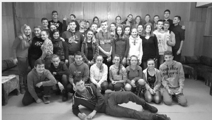
Birmovanci na duchovnej obnove v Pružine