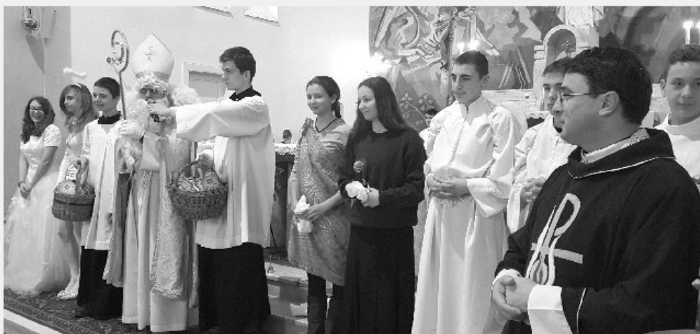
Sv. Mikuláš sa cítil v kostole medzi deťmi ako doma