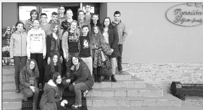
Duchová obnova deviatokov sv. Augustína v Oščadnici