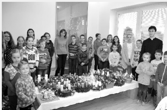
Požehnanie adventných venčekov